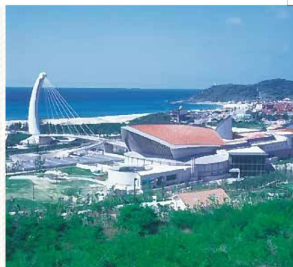
日本海に面する、島根県浜田市にある中四国最大級の水族館