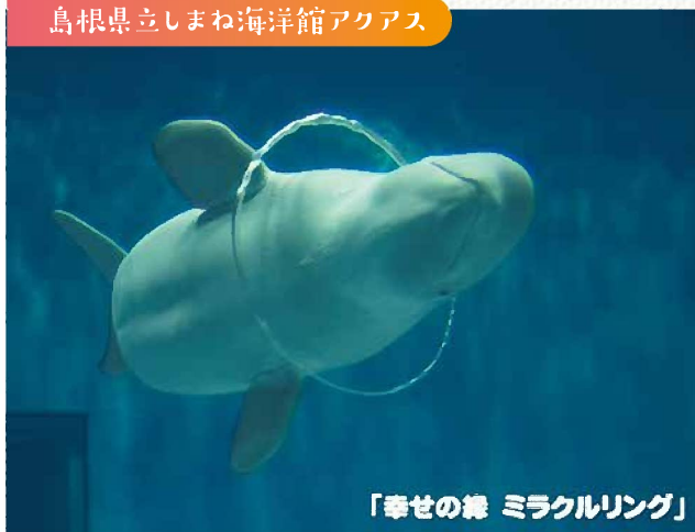
「幸せの鯨 ミラクルリング」